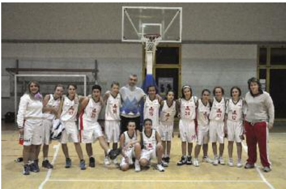
Il giovane gruppo che quest'anno ha raggiunto le finali Under 14 e Under 15, in un'immagine di repertorio

Doveroso il tributo alla Serie B, che ha conquistato la promozione, ma impossibile non ricordare, seppur brevemente, le altre formazioni del basket della Polisportiva. La Serie C , abbinata Mazzini, si è ben comportata, a ridosso delle squadre play off. A livelli di assoluta eccellenza, come sempre, le Under 14 , seconde in regione dietro alla solita Libertas. Un campionato non semplice, costellato da numerosi, pesanti infortuni, condotto all'insegna della regolarità e del dispiegarsi di un maggior tasso tecnico e atletico nei confronti delle avversarie. Bene anche le Under 15 , seconde nella finale della Coppa Emilia-Romagna, di fatto seste in regione. Il tutto con un organico di sole quattro giocatrici del '96, supportato dalle Under 14, che si sono così sobbarcate un doppio campionato. Stagione oltre le aspettative per le Under 13 , partite tra mille difficoltà ed arrivate anch'esse fino alla finale della Coppa Emilia-Romagna. Un gruppo che è cresciuto piano piano, imparando ad allenarsi, a vincere e soprattutto a divertirsi... Le