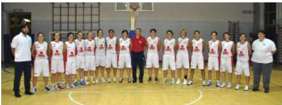
La squadra SMC Holding Lame che ha conquistato la promozione in B Nazionale

Quando si vince un campionato (promosse in B Nazionale!) la prima cosa che si deve fare è festeggiare e celebrare una stagione esaltante. E in questo noi "lamette del basket" penso che siamo state le capolista assolute (salutateci...) in quanto a cori, scherzi e gag all'insegna della goliardia che un po' ci contraddistingue e che ci fa andare avanti nei momenti di difficoltà, che non mancano mai nelle stagioni sportive, a volte molto lunghe. Le difficoltà ci sono state anche in questa stagione, a partire dal suo inizio che sembrava incerto, ma poi il gruppo "storico" ha saputo stringersi ed accogliere i nuovi arrivi, formando una squadra solida e decisa a salvare i mercoledì sera dall'ira del coach. E da qui la lunghissima striscia di vittorie, interrotta solo dalla sconfitta con Ferrara... E poi è stata una storia di inseguimenti senza perdere mai colpi, una sconfitta inaspettata, ma poi di nuovo lì, fino allo scontro diretto vinto col cuore e la determinazione di chi non ha voglia di