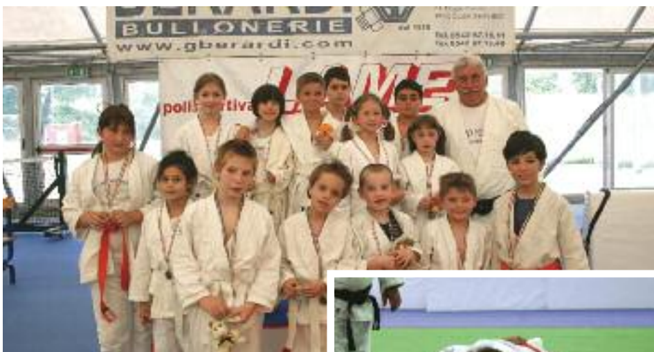
Giovani judoka durante il secondo Memorial Zarattini