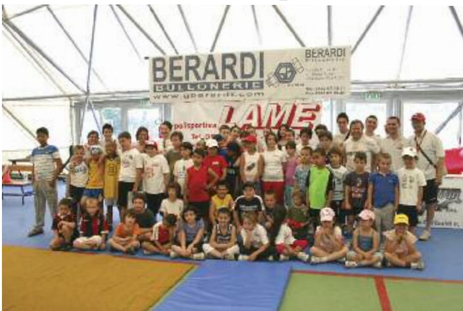
Foto di gruppo dei partecipanti alle Olimpiadi 2011. Sotto, una "tiratissima" gara di tiro alla fune

Golden Sisters 1 e 2, Aquile, Draghi, Team Jordan, Coccinelle, Leopardi... ma chi sono? E chi, se non le squadre di bimbi che si sono formate per partecipare alle "Olimpiadi" organizzate, il 21 maggio scorso, in occasione della Festa della Polisportiva Lame ? E sembra si siano divertiti tutti: gli atleti, sicuramente, ma anche gli allenatori e i genitori, che hanno voluto seguire i propri figli nelle rotazioni previste e mettersi alla prova insieme a loro in un'attività in cui sapevano di non essere, diciamo, vincenti!