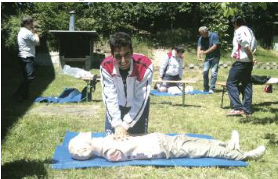
Calcio all'avanguardia nella formazione per fronteggiare le emergenze sanitarie in campo

Tra le "cose fatte" annoveriamo il tradizionale torneo: "Un bambino che gioca vince sempre" che si è svolto nei mesi invernali e che ha visto la partecipazione di oltre 10 società della nostra provincia che hanno disputato circa 60 partite. Se