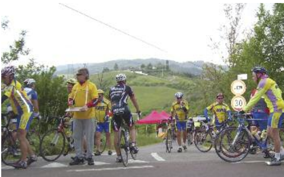
Sotto, ciclisti al ristoro

pedalare intorno al massiccio del Monte Bianco tramite un suggestivo percorso "a tappe" che prevede la scalata di molti valichi