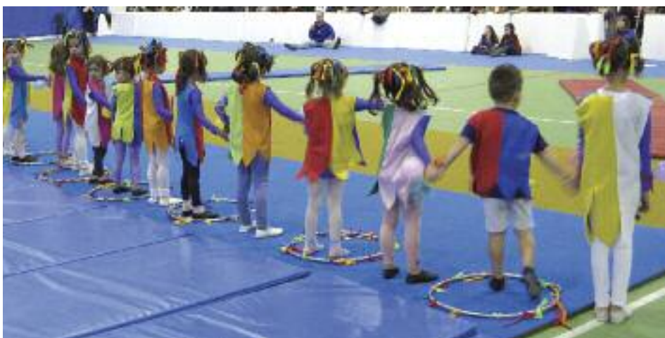
Ginnaste all'opera al PalaLame

Il gruppo agonistico ha partecipato a due prove dei Campionati Regionali UISP di Ginnastica Artistica che si sono svolti rispettivamente a Rimini e a Cattolica. Le nostre atlete si sono classificate al 2° e 3° posto qualificandosi ai Campionati Nazionali UISP che si sono svolti a Fano il 28 maggio scorso. Inoltre abbiamo partecipato a saggi dove si sono esibiti insieme tutti i gruppi di differenti età. Il primo di questi a febbraio proponendo come tema coreografico "Notre Dame de Paris". L'ultimo appuntamento è stato l'11 giugno con il saggio di chiusura attività presso il Pattinodromo di via Vasco de Gama. Una bellissima esperienza è stato lo spettacolo che la Polisportiva Lame ha presentato al Teatro Arena del Sole che ha visto esibirsi i settori Danza e Ginnastica Artistica insieme; una collaborazione che già da tre anni ci unisce in un lavoro comune. Lo spettacolo è stato una grande