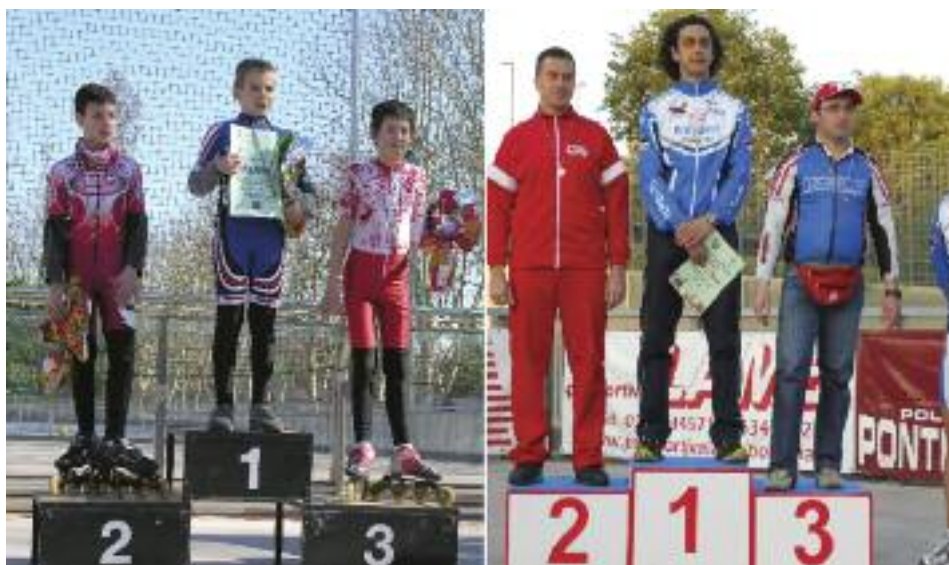
Sotto, la Squadra Agonistica Pattinaggio Artistico